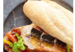
地の野菜を使用した バケットサンド