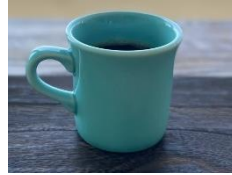
スペシャルティコーヒー