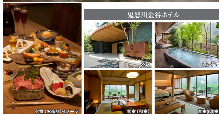
夕食(お造り)イメージ