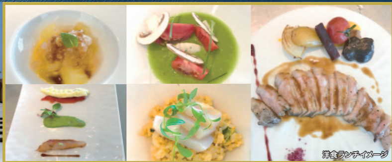
洋食ランチイメージ