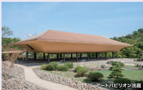
アートパビリオン洗庭