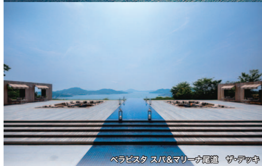
ベラビスタ スパ&マリーナ尾道 伊テック

せとうちSEAPLANES