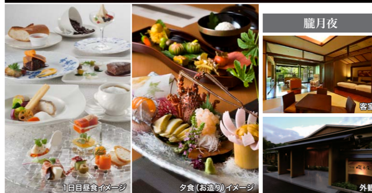
1日目昼食イメージ