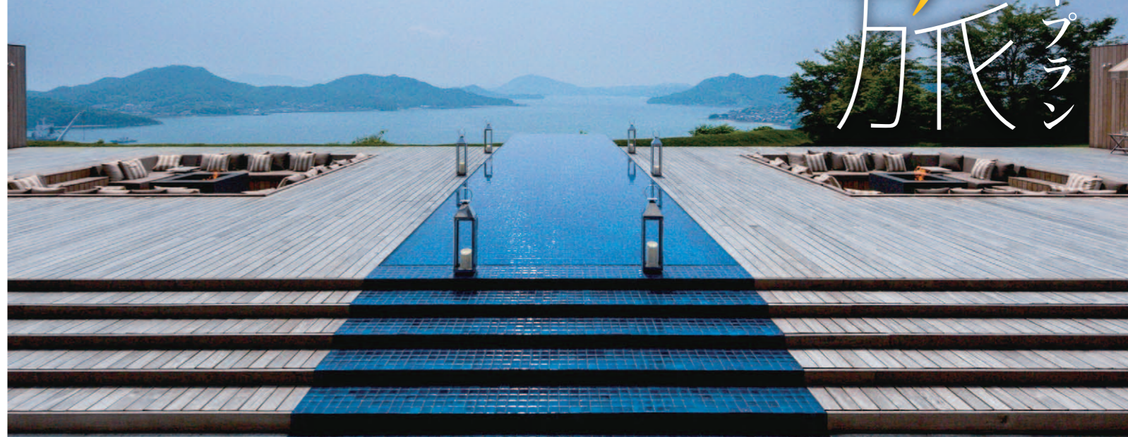
ベネチスタ スパ&マリナカ尾道 予約済み

ハイグレード・ハイヤープラン 自游旅 今までにない極上の旅へ ご自宅からご自宅までエスコート いつもと違う景色の中へ 大切な人と出かけてみませんか?