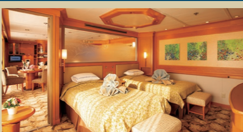
6F ジュニアスイート バルコニー・フローバス・トイレ付/31㎡