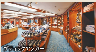
プフィックアンカー