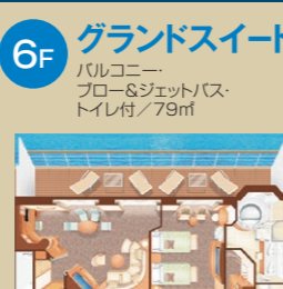
6F グランドスイート バルコニー・フロー&ジェットバス・トイレ付/79㎡

スイートルーム限定「にっぽん丸バトラー」 にっぽん丸バトラーのおもてなし クルーの中でも経験豊富な人材がスイートルーム専任バトラーとしてサービスを提供。ショーのお席の確保やイベントの事前確認・ご予約、お食事のご希望など、さまざまなご要望にきめ細かに対応いたします。