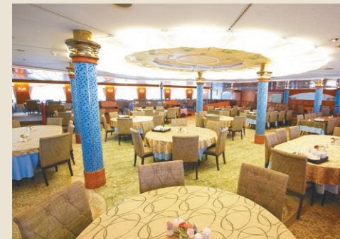
メインダイニング「瑞穂」

グルメ 「美食の船」と呼ばれるにっぽん丸。一皿一皿思いを込めて作る料理を、それぞれのメニューにあった最上の環境で味わっていただきます。私たちの“こだわり”を心ゆくまでご堪能ください。