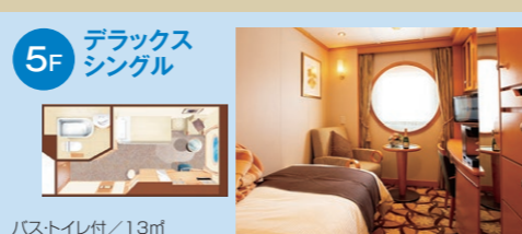
5F デラックスシングル バス・トイレ付/13㎡