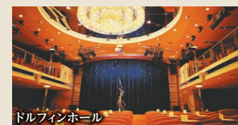
ドルフィンホール

思い出の品を探す船内でのショッピングや、趣向を凝らしたステージでのショーも船旅ならではの楽しみ。船上での日々は、常に新しい刺激に満ちています。