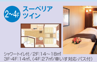
2~4F スーペリアツイン シャワートイレ付/2F:14~18㎡、3F-4F:14㎡、(4F:27㎡/車いす対応バス付)