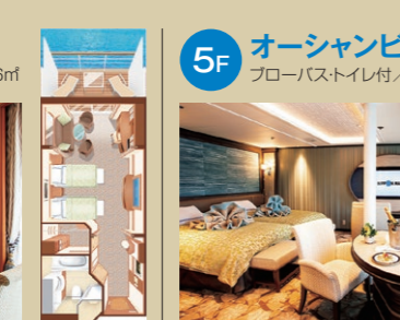
5F オーシャンビュースイート フローバス・トイレ付/33㎡