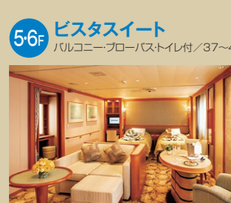
5/6F ビスタスイート バルコニー・フローバス・トイレ付/37~46㎡