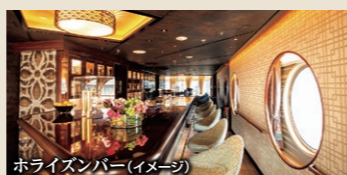
ホライズンバー(イメージ)

大海原を眺めながら食事ができる開放感あふれるダイニング。美食へのこだわりをさらに追求した空間で、にっぽん丸の味に精通したソムリエ田崎真也監修のワインセラーも備えています。※夕食はスイートルーム・デラックスルームのお客様の優先ダイニングとなります。