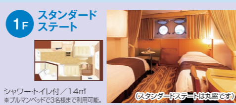
1F スタンダードステート シャワートイレ付/14㎡ ※ブルマンベッドで3名様まで利用可能。