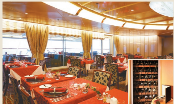
オーシャンダイニング「春日」

海の豊穡を描いた信楽製大陶板が一際目を引く、にっぽん丸のメインダイニング。きめ細やかなサービスでバラエティ豊かなお食事を提供します。