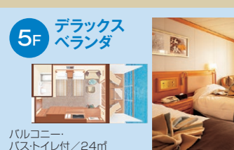
5F デラックスベランダ バルコニー・バス・トイレ付/24㎡