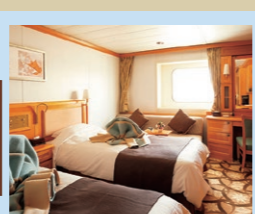
5F デラックスツイン バス・トイレ付/19㎡