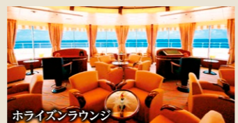
ホライズンラウンジ

刻一刻と変わる眺めは、クルーズの大きな魅力の一つ。移りゆく名も無き絶景たちを、お楽しみください。