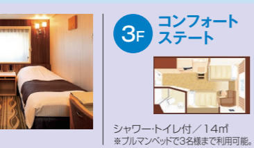
3F コンフォートステート シャワートイレ付/14㎡ ※ブルマンベッドで3名様まで利用可能。