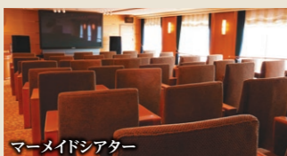
マーメイドシアター