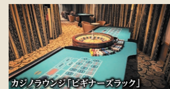
カジノラウンジ「ピキナズラック」