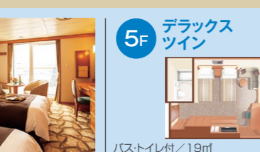
5F デラックスツイン バス・トイレ付/19㎡